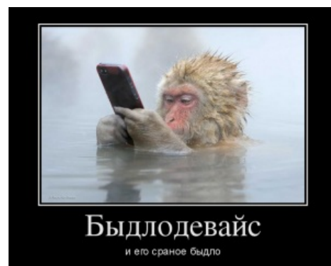
Своего рода селфи

В искусстве очень православно раскрыто в мульте «Царь Горы» (« Nine Pretty Darn Angry Men »), где Человек-Пропан борется (и превозмогает) с быдлопрогрессом в виде газонокосилки, с которой производителю пришлось удалить собственно ножи, скашивающие траву, дабы в ней уместился круиз-контроль.