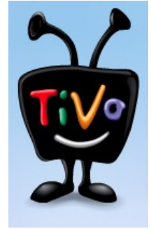
Linux-зомбоящик , полный хуйцов для гиков и красноглазиков