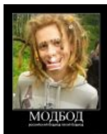
Русский бодмод как он есть

производства, выпендрёжников терпят — исключительно ради создания видимости большого числа участников движения.