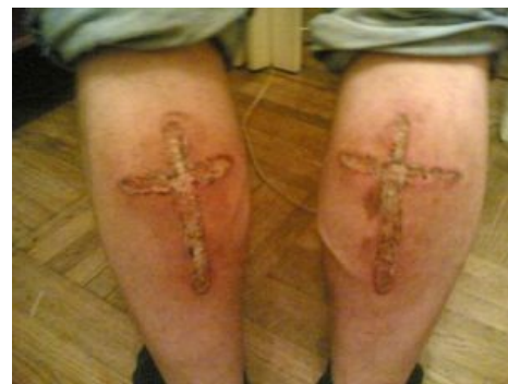
Православно грамотный бодмод