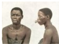
Ориджинал бодмод расового африканского нигры