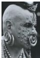
Расовый германский бодмод (2009)