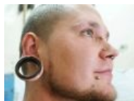
Я крутой бодмодер!