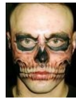
Рик Джэнест. Человек-Смерть.