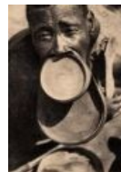
Красота — страшная сила