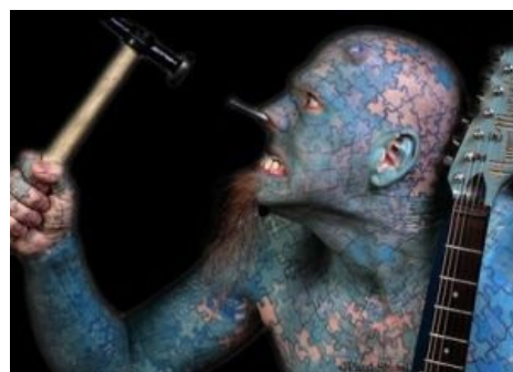
Гвозди бы делать из этих людей