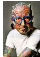
Французский дьявол Этьен Дюмон