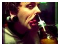
А я ещё круче!