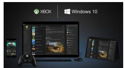
Поставь Windows 10 на Xbox, или мы сделаем это за тебя