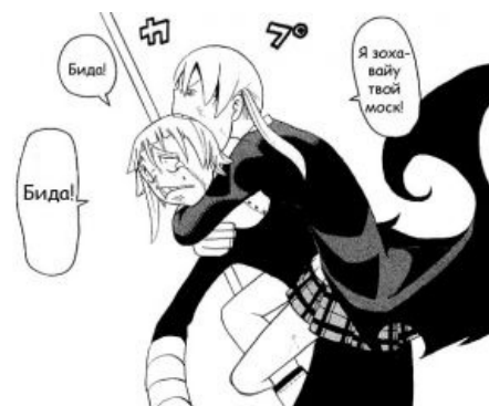
Сферическая бида в вакууме.

Некто из анонимусов рисовал пародийную картинку в MS Word, не убрав при этом проверку орфографии, вследствие чего на итоговом изображении все слова, кроме слова «ТВОЙ», подчеркивались красной волнистой чертой. Это породило своеобразный мем-спутник: на некоторых изображениях слова подчеркивали нарочито корявыми красными линиями. Впрочем, «орфография» как мем не прижилась, чего не скажешь о «биде», про которую вспоминают при каждом случае захавывания моска.