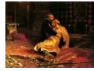
Иван Грозный тоже в теме.