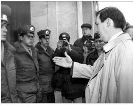
На этих юнитов колдунство Гончара не сработало

хакнуть выборы и пролез в председатели Центризбиркома (тогда их назначал парламент), откуда пригрозил не допустить чуровщины. В ответ на это в его кабинет посадили Лидию Ермошину из Бобруйска , а на входе поставили каких-то тщедушных задротов из президентской охраны. Гончар привёл Шарецкого и применил его на дверь, но это не помогло. Квест оказался зафейлен.