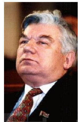
Это — настоящий президент Республики