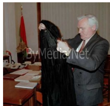
Вы как хотите, а я пошёл

Самым кошерным был первый вопрос — «Поддерживаете ли вы конституцию в редакции президента?» Конституция была настолько хороша, что её показали народу только через 3 дня после начала голосования. По ней президент получал права root и полномочия, превосходящие полномочия императора России, которую мы потеряли , парламента распиливался надвое, импичмент становился невозможен и т. д. и т. п.