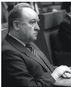
Кебич смотрит на список своих конкурентов

Президентские выборы 1994 года были ужасающе демократичными. Белорусский народ выбирал из целого вывода кандидатов один адекватней другого.