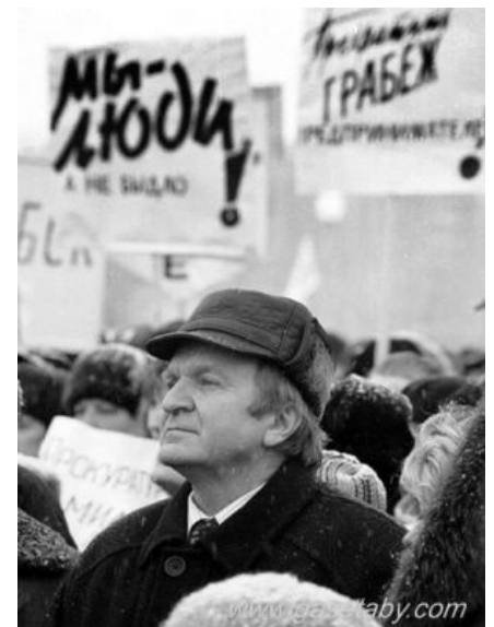
Чигирь смотрит в будущее. Там

Наконец, Гончар утёрся и заявил, что выборы, ввиду бегства кандидата, сорваны, а временным президентом становится... Шарецкий. Тот сказал «спасибо», уехал в США и стал с тех пор не виден и не слышен. Подпольные протоколы подпольного Центризбиркома