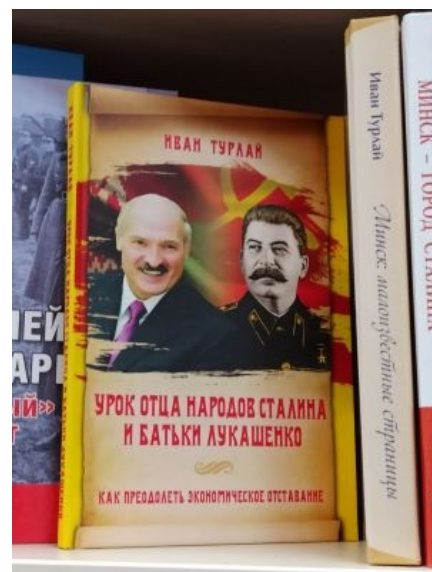
Только массовые расстрелы...