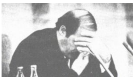
У Бацьки фасерпalm от таких подчинённых.