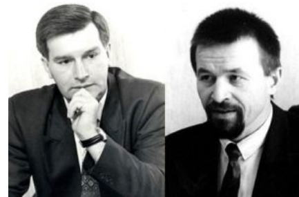
Ищут пожарные, ищет милиция, Яндекс и Гугл , и Торадиция