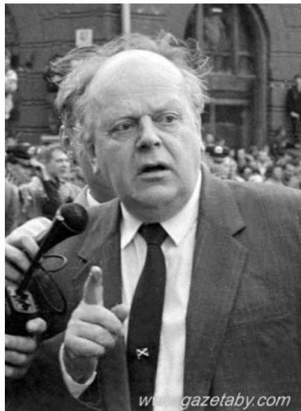
Глава белорусского государства. Альфа-релиз

прописали перейти на родную мову не сразу, а к... 2000 году (а потом за пару лет достроить коммунизм).