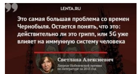
Нобелевский лауреат, гений всех наук, эксперт по всем вопросам