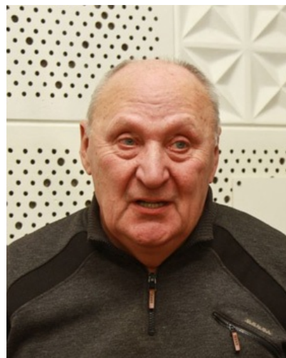
Глава белорусского государства. Бета-релиз

«Я знаю, как во втором туре люди шли (голосовать в 1994-м). С постели не поднимались годами. Они не доверили своим детям: я сам пойду за Лукашенко. Вставали. Их несли, везли на колясках — они за меня голосовали. Это было море таких людей. »