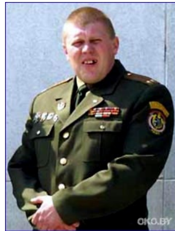
Полковнику Павличенко скрывать нечего!

На результат выборов 2001 эта версия не повлияла никак, зато змагарские СМИ получили уйму копипасты, которой обмазываются каждый раз, когда случается повод помянуть. Много позже в Минск приезжал ЕСовский чиновник Пургуридес, якобы видел явление Шеймана и другие чудеса и составил очень мутный доклад, который в основном состоит из пересказа этой копипасты. С тех пор Шейман и ещё куча народу — невъездные в ЕС, на что они не особенно-то и в обиде.