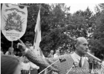
Зянон! Он вернулся!

26 апреля, на митинге в годовщину Чернобыля (на который собралось народу порядочно — где-то 20 тыс.) ВНЕЗАПНО появился Позняк. Сжёл российский флаг, попросил слова, долго и проникновенно говорил, а потом... объявил минуту молчания в память невинно убиенного Джохара Дудаева. И на этом месте народ понял, что вождь-то — психический.