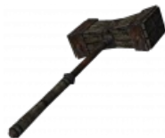
Молот Бан из Морровинда.