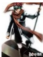
Лави из D Gray Man