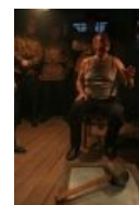
Банхаммер и «кроваяя гебня».