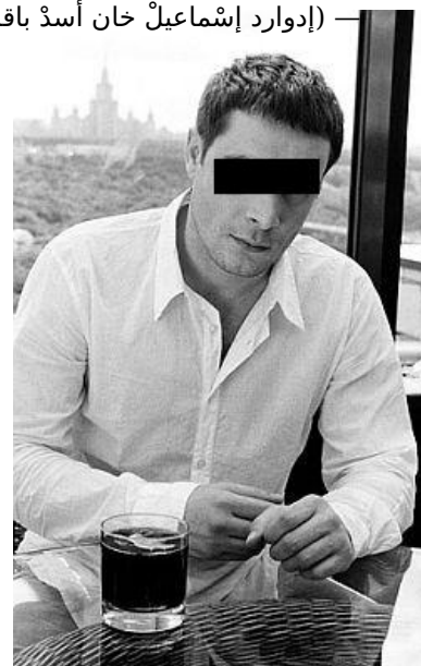
Это человек, похожий на Багирова

Багиров Эдуард Исмаилович ( u u bagirov ) (басурманск. إدوارد إسماعیل خان أسد باقر شاه مشهدی باقر زاده ) — расовый чурка. Распеаренный Рыковым воинствующий хомячок, изо всех сил пытающийся казаться Джеймсом Бондом, Ричардом Брэнсоном и Чаком Палаником в одном лице. Не вполне психически здоров. Один из былиннейших чмошников и мудаков рунета и, в частности, ЖЖ. Видный рупор русофобского сосаети, пожелавший петербужцам второй раз пережить блокаду. Набрал в интернетах некоторую популярность после того, как стал редаком Литпрома под псевдонимом Сфинкс. С января 2008 по 30 июля 2012 член Всероссийского Азербайджанского Конгресса. Доверенное лицо кандидата В. В. Путина на выборах 2012. Работает пидорасом у клоунов. Как и любой непризнанный гений, обладает зашкаливающим ЧСВ. Любимое хобби — стыдливо-трусливое подтирание и редактирование своих постов, что, контрастируя с их охуенно дерзким, циничным и неполиткорректным (когда надо — архиполиткорректным) содержанием, люто, бешено доставляет.