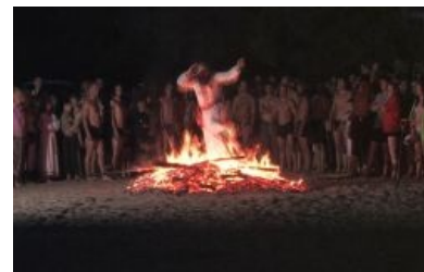
Ахиневич горит в аду (хотя некоторые считают, что его принесли в жертву богам)

Древняя история в изложении Ахиневича предстает покруче «Звёздных войн» : оказывается, первые люди Белой Расы переселились на Землю (Мидгард) из созвездия Большой Медведицы во время Третьей Космической войны, когда в Солнечной системе насчитывалось аж 27 планет, а у Земли было три Луны. Первоначально они жили в стране Даарии, расположенной на приполярном материке Арктиде. Различия цвета кожи (белая, красная, желтая, зеленая, черная) у нынешних и вымерших рас объясняется Ахиневичем тем, что предки разных рас прибыли на Землю с разных звездных систем. Инглиизм запрещает межрасовые браки, что привлекло к Ахиневичу наивных расистов. Также Ахиневич невозбранно пропагандирует телегонию .