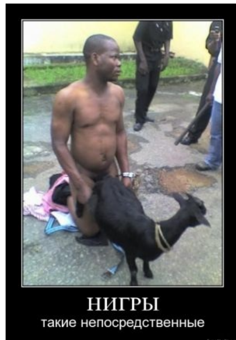
Фото типичного жителя Африки после обработки фотешопом

https://www.youtube.com/watch?v=jPONY2ZG-mU