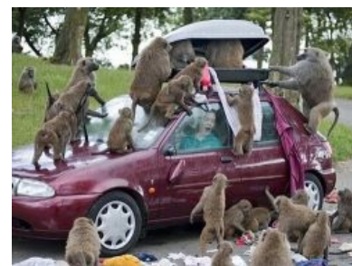
Грабёж корована по-африкански. ОН SHI... в Англии

Итак... стандартная страна этого континента — банановая республика с 3-4 императорами и/или диктаторами (чем пользуются некоторые, посылая нигерийские письма от лиц свергнутых с просьбой отстегнуть денег). В каждой стране обязательно имеется минимум один район с сепаратистами, де-факто не контролируемый правительством.