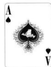
ace of spades