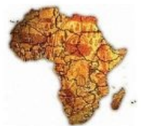
space of aids