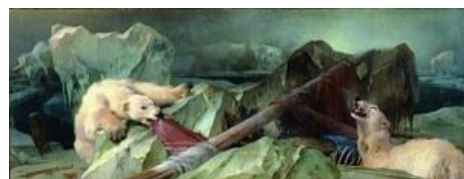
«Человек предполагает, а Б-г располагает».

Результаты экспедиции: в течение 150 лет, и по сей день ещё, искатели разной степени упоротости находят останки экипажа, а сама экспедиция, по своей загадочности уступающая разве что экспедиции