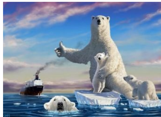
Жги исчо, чилавек!

Джон Франклин был отличным моряком. Он принимал участие в экспедиционных походах с младых