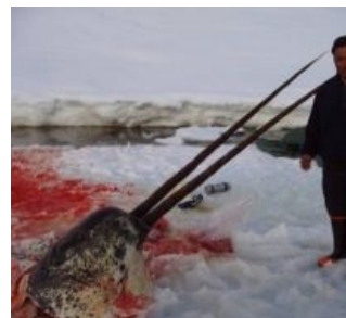
И кто здесь животно?

Группировка нарвалов в естественной среде обитания