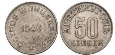
Один из номиналов