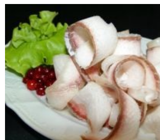
Кушай, не обляпайся