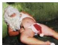
Santa Claus North Pole, Alaska