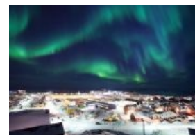
Рождество в Гренландии

Однако вин всё же вскоре настал. В 1908 Фредерик Кук заявил, что он на Северном полюсе был и всё видел, мамой клянётся. Однако, когда у него спросили: «Какие ваши доказательства?», пруфов не оказалось. Низачод.