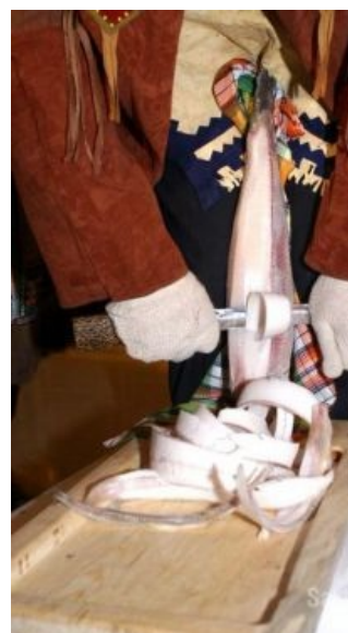
Один из православных способов нарезки