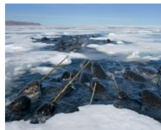
Группировка нарвалов в естественной среде обитания

А рассказанная викингом сказка была такой. Одна девушка вымыла свои волосы мочой и растянула их сушиться на веревке рядом с тряпьем. Ветер подхватил тряпье и бросил его в море. Так появилась скалугсуак — гренландская полярная акула.