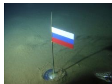
Российский флаг на DNIWE Северного полюса. Люби Россию, пидор!