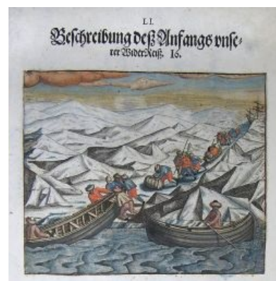
Арктические плаванья Виллема Баренца в 1594—97