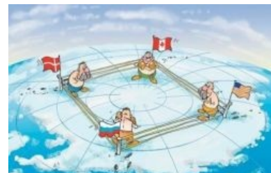
Художник спутал Арктику и Антарктику

В дремучем начале XX века Арктику, как пирожок, нарезали на секторы СССР, Штаты, Канада, Дания и Норвегия. Первыми наложили лапу на свой сектор канадцы. В 1926 году СССР установил себе полярные владения — от Кольского полуострова до Северного полюса и обратно до Берингова пролива. Разделение предполагало, что, кто бы ни нашёл новую землю, принадлежать она будет хозяину сектора. А вот про льды и водичку как-то не упоминалось. К середине XX века стало ясно, что всё уже найдено — спутники фоторазведки и гуглмэне гарантируют. И всем было похуй, пока относительное потепление последних лет в Арктике не вскрыло, что под Северным Ледовитым лежат ничейными дохуя и более ништяков . В 1997 Рэфию таки продавили подписать Конвенцию по морскому праву, по которой устанавливались 12 миль территориальных вод (никто чужой не суётсье вообще) и 200 миль исключительной экономической зоны (плавать может кто угодно, а вот рыбку ловить или бурить — только хозяин). Можно откусить и кусок побольше, если доказать, что вот это дно есть продолжение шельфа, но сроки подачи заявок ограничены. В результате этой замутки миллионы квадратных километров вокруг полюса оказались ничьими, а чтобы вернуть часть из них, нужно резко подсуеетиться.