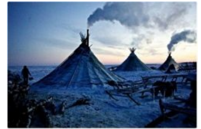
Целый поселок из таких принадлежаний инуитам пастухам, стоит в арктической тундре в Нюнолде арктической округе. Инуиты - коренные жители российской части Парарного круга. Они жили здесь еще до советской колонизации и уехали до начала давления со стороны нефтяников-американцев.

Ну а аборигены живут здесь так же, как жили всегда: разводят оленшков , однако, ездят на собачках, кочуют по тундре. Попытки приучить туземцев к цивилизации приводят к утрате ими +100500 резиста к холоду, поэтому приучаться они не желают . Вопреки расхожему мнению, коренные народы в Арктике — это не только монголоидные эскимосы, не снимающие своих шкур и просиживающие булки в ледяных юртах, но и более-менее белые люди, такие как саамы, а также коренные американцы .