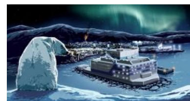
УмкаГазпромЪ на фоне полярного сияния

Ныне в этой стране попадание в Арктику происходит с двумя возможными мотивировками: «за длинным рублём» (обычно вахтовым методом ; особо упоротые переезжают в далёкие ебенья насовсем за «северными надбавками») и «Родина послала». В первом случае проживать покорителю Севера приходится либо в вахтовом посёлке из вагончиков, непрерывно въёбывая на благо Газпрома или Роснефти — зато с гарантированным возвратом домой по окончании вахты, либо в относительном комфорте одного из здешних городов и посёлков — зато всерьёз и надолго. Рядовому составу армии предстоит жить здесь до дембеля — зато офицеров ждёт долгая и тоскливая служба, задвигают на которую за различные провинности и косяки. Например, переспал курсантик с генеральской дочкой и бросил — тогда вместе с лейтенантскими погонами ему просто гарантирована долгая служба на