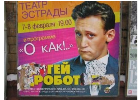
Народ ненавязчиво намекает

• Святослав Ещенко (по данным Урганта — Станислав) — ничего особенного из себя не представлял, выдавая смишные шутки в стиле каллеги Дроботенки. Высмеивал панков, старых пердунов, новых русских и так далее. Сливали ему репертуар, который даже для Петросяна оказался недостаточно смешным и слишком кондовым — можете себе представить, что это было.