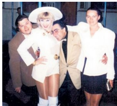
И правда — альфа-самец