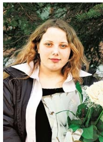
Б-гиня смотрит на тебя.

— http://www.webplanet.ru/news/internet/2005/3/29/pisk_love.html