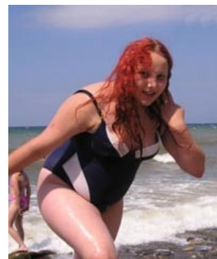
Знойная женщина, мечта поэта!