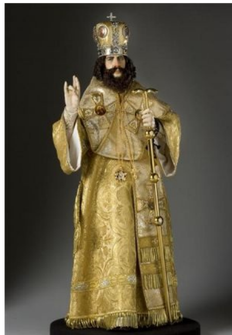
Патриарх Nikon™. Сегодня уже в статуэтках

Ну и, разумеется, Никона тоже отправили КЕМ сразу же после завершения реформ. А нехуй тут думать, что тоже чего-то стоишь, когда есть богоподобный царь хранимой этим самым Б-гом России. После такого экстерминатуса , учинённого церкви, неудивительно, что Петру почти без сопротивления дали делать с ней всё, что угодно. Тем более, что часть особо тупых перемен откатили обратно ещё до Петра. Но, тем не менее, вплоть до конца Империи раскольники-старообрядцы почитались неблагонадёжными и были