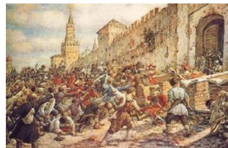
Подавай царь вора Бориску!

При этом госчиновникам открыто увеличили жалование, понадавали льгот. Естественно, простой люд смотрел на цены, заглядывал в свои тощие кошельки, потом на жирующих чинуш и стал что-то смутно подозревать. Царю послали челобитную, жалобу на бояр и потребовали созвать очередной Земский собор. Но по обычаю того времени все челобитные клались в долгий ящик (откуда и пошло выражение), где благополучно забывались. Тогда народ встретился с царем самолично. Случилось это в тот самый момент, когда Тишайший возвращался из Троице-Сергиевого монастыря с богомолья. Тот, аки Путин, бунтовщиков выслушал, пообещал разобраться и спокойно укатил домой. На следующий день чернь снова оторвала Алексея от богоугодных занятий (церковного хода) и опять за своё: «разберись, да разберись». Царь так же спокойно и рассудительно попросил их подождать конца службы (прямо как тот англичанин из анекдота про Темзу ), а чуть позже отправил своих переговорщиков разбираться.