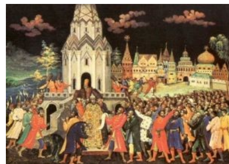
Привет, царь, как дела?