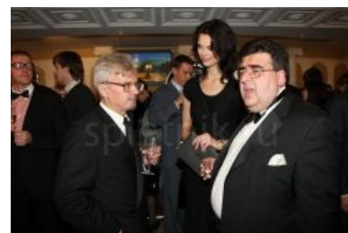
Митрофанов и нацбол Лимонов пьют за Россию