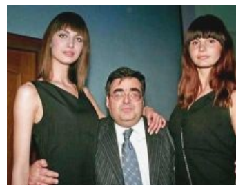
Он — альфа-самец , а ты — неудачник .