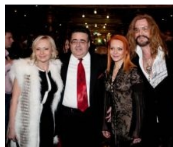
Митрофанушко в компании трёх тупых пёзд, причём одна из них — с хуем.