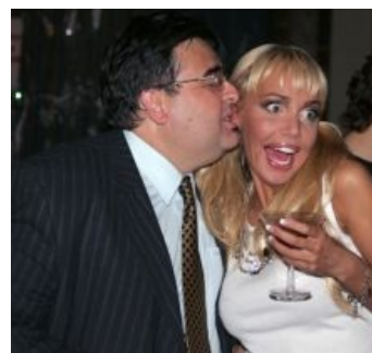
Все девушки его!