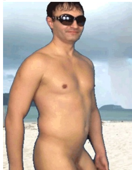
Angry Guyzzz - Александр