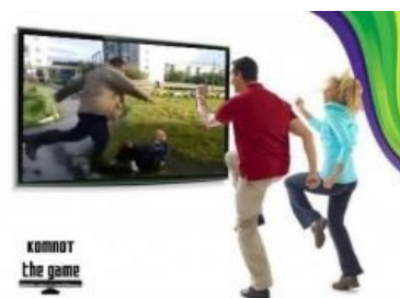
Играть только с кинектом!

То самое видео, активно выпиливаемое модераторами БЫДЛОЦЫКЛ - Школьник Песня от БыдлоцЫкла