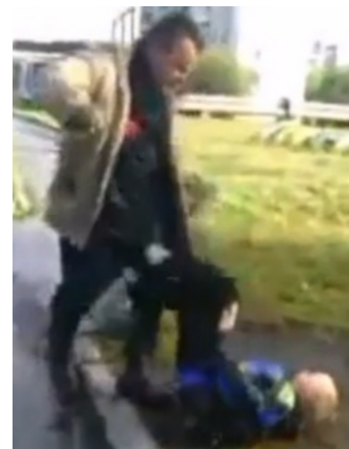
Сабж в процессе преподавания

А между тем — игроделы из б-гмерзкого Вконьтактика таки запилили онлайн-аркаду: « Симулятор жизни Компота ». Без кинекта. Зато с дескриптором, внахапку упирзованным из преамбулы этой самой статьи .