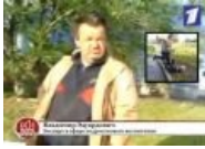
Интервью с заслуженным мастером