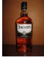
Вы абсолютно не понимаете сути пустошей педагогики