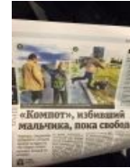
Компот в СМИ