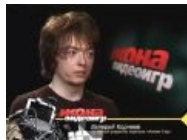
В эфире MTV , 9 сентября 2007, после дозы.