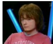
У Гордона (от сабжа — одна реплика)