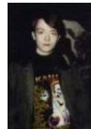
Молодой Купер такой молодой.