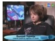
После дозы ver.2.0, декабрь 2011.

Тег EmbedVideo не может распознать сервис "yandexh5".