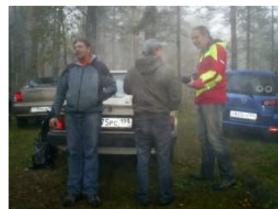
Стоянки машин на «Эльбах». Нормальные пацаны уже давно стопом не ездят!

Чем же занимаются автостопщики на этих своих эльбах? Всем тем же, чем и остальные нормальные люди: тунейдством, пьянством, блядством. Помимо сего, популярно бренчанье на гитарах и периодически общение с параллельными мирами . Некоторые в пьяном угаре развлекаются тем, что ходят в деревню, где пугают местных жителей, которые уже в принципе привыкли, что 2-3 раза в год на их деревню производится нашествие страшных людей, и относятся к этому, как к неизбежному злу. Алсо, популярной игрой на эльбе является «слон», заключается в том, что куча здоровых долбоёбов прыгает друг на друга, пытаясь свалить окружающих с ног. Зрелищно и доставляет. Особо интеллектуальные личности умудряются среди всего этого играть в Что-где-когда .