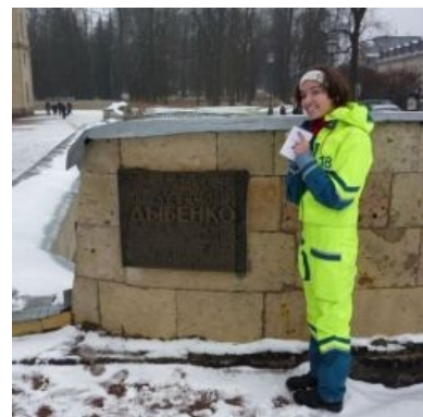
Поциэнт ГМА под веществами.