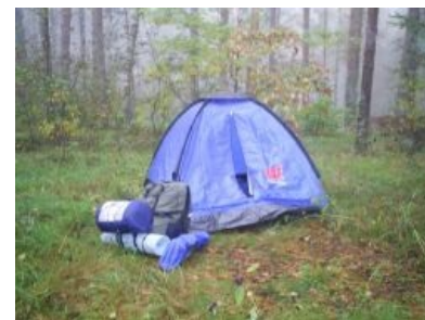
Вот мой дом родной.

Живут автостопщики только в своих палатках, поставленных в кустах на обочине трассы, и на вписках у таких же офтостопщеггов. Некоторые особи умудряются скооперироваться по двадцать человек и снимать однокомнатную квартиру, как настоящие среднеазиаты . Основная еда — это макаронны с тушёнкой , изготавливаемые на дешёвой китайской горелке, и конечно же, бомжпакеты , разведённые кипятком, выключенным в кафешках на стоянке. На вписках также популярны пельмени , поскольку дёшево и сердито.