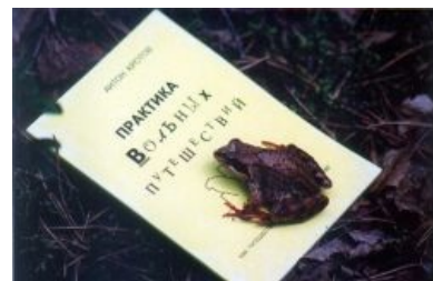
Даже лягушки читают «Практику»