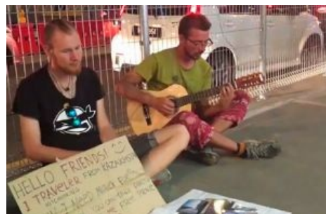
«Творческие» из Казахстана .

Есть такие экземпляры, которые используют как средство для попадания в