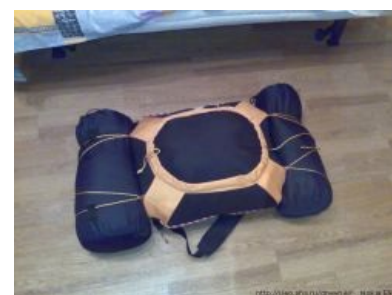
Рюкзак имени А. Ворова. В отличие от большинства рюкзаков, загружается не изнутри , а снаружи