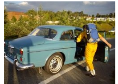
Подвези, дяденька! Бесплатно!