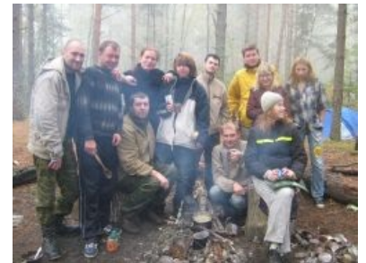
Автостопщики на лоне природы

Обычно подразумевается, что за такой подвоз следует развлекать водителя интересной беседой или рассказами. В реальности же далеко не у всех водителей есть желание слушать словесный понос взятого им молодчика об особенностях автостопа в Аргентине и Перу, особенно если этот водитель дальше своей Кировской области никогда не ездил. Но даже если водитель взял попутчиков с целью пообщаться, ему это удаётся реализовать не всегда, поскольку некоторая часть автостопщиков, едва сев в машину, сразу отрубается и дрыхнет без задних ног, радуя драйвера-альтруиста лишь гармоничным сопением, а то и бодрящим храпом. Связано это обычно с тем, что они могут ехать не первые сутки без остановок (а иногда, потому что до этого бухали не первые сутки без остановок), а потребность сна для организма ещё никто не отменял. Времени, чтобы остановиться где-нибудь и выспаться, у стопщика нет (надо успеть срочно к 1 сентября на учёбу, а то отчислят), а на поезд как всегда нет денег . Поэтому единственный