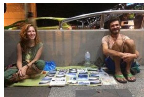
Типичные торговцы фотками (по факту — попрошайки) в Бангкоке.

Такая популярность ЮВА среди «вольных путешественников» связана с тем, что путешествия там — это очень easy mode . Низкие цены на все, дружелюбное население, хороший автостоп (что связано с особенностями менталитета местных жителей, которые уверены, что бесплатный подвоз всех желающих улучшает карму), отсутствие визового режима и различных неприятных законов (это особенно радует путешественников из стран типа Германии , где вся повседневная жизнь сильно зарегулирована законами), а самое главное — там легко заработать денег, если у тебя европейская внешность. Можно, например, быть преподавателем английского ( native speaker-ом для этого быть совсем не обязательно), моделью (если внешность позволяет), и ещё много кем, а также продавать фотки, сделанные в путешествиях (непонятно, кто и зачем их покупает, но это довольно-таки прибыльное занятие). Но с середины 2010х в ЮВА огромным потоком хлынули банальные попрошайки,