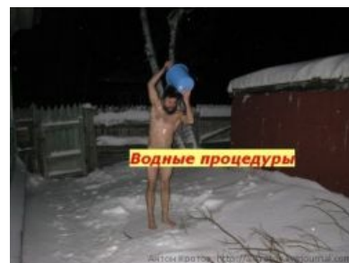
Нелёгкие архангельские будни гуру-писателя (горячую воду отключили)!