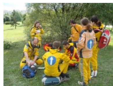
Крутые гонщики нарисовали