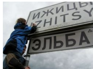
«Киса и Ося были здесь!»

Впоследствии, в других городах и странах тоже завелись стоппари, причём в немалых количествах. Им не очень доставляло ездить в Ижицы, поскольку добираться откуда-либо, кроме двух столиц (и Твери с Новгородом) туда достаточно геморройно (хотя многие не напрягаются на пару дней на 1000 км от дома смотреть ради тусы). Тогда они стали организовывать свои эльбы и звать активно туда народ. Так появилась Украинская (известная анальным огораживанием) и Белорусская (известная засилием всяких левых пинско-могилёвских говнопанков ) эльбы, Уральская, Сибирская, Урало-Поволжская (Азиопа), Краснодарская (Отличалась тусой на море, а так же обязательным купанием всех в голом виде, в результате понятно чем кончалось часто, ныне вроде выпилена по причине того что все пригодные участки пораскупили и огородили) периодически появляется Кавказская, в 2009 году случилась впервые в истории Камчатская эльба, а в 2010 году Бродячая автостопная эльба, дошедшая до Владивостока! В последнее время уже стало модным любое место, где собирается более трёх стопщиков называть «эльбой».