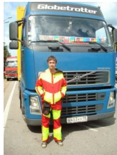
Типичное быдлофото жителя трассы — на фоне согласившейся подвезти фуры.

Стоит пояснить, откуда берётся подобное ЧСВ у автостопщиков. Большинство окружающего их народа в Замкадье обычно выпадает в осадок при мысли о том, что они общаются с человеком, которому было не в лом поднять свою задницу с дивана, стоять на трассе, стопить машины ради того, чтобы припереться в их ебень . Для них, пару раз в жизни выехавших за пределы родного колхоза, такой человек кажется чем-то сверхъестественным . Это отношение и в самом деле меняет сознание некоторых вольных путешественников, которые после общения с таким народом начинают считать себя сверхлюдьми .