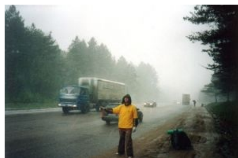
Типичный поцыэнт в естественной среде обитания.

первая заповедь автостопа Джордж Карлин раскрывает суть непосвященным