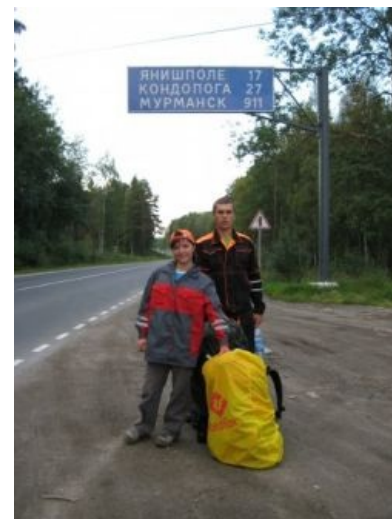
Дорожный указатель на фоне автостопщиков