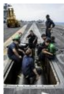
Пиндостанская мазута. Таки да, там пускают на борт тян