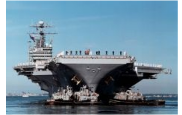
USS George Washington оказывает психологическое давление