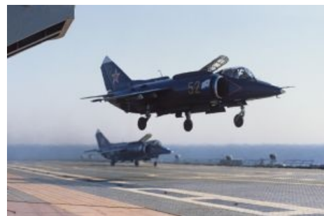
Як «Об палубу Хуяк» 38 модели

Как уже было сказано, к окончанию Второй мировой своего авианосного флота у Совка не было. Взятый в трофеи немецкий «Цепелин» оказался разьебан настолько, что восстановить его не было ни сил, ни средств. Да и не сильно этот флот стремились строить и после — миролюбивому советскому народу оружие империалистической агрессии, как считала партия, было не нужно. Хотя чертить проекты начали еще в 40-е, с приходом маршала Горшкова их было решено похерить — но, как это и бывает в нашей стране, после смены Хрущева на Брежнева тот резко поменял мнение, и авианосцы Советскому Союзу резко стали необходимы.