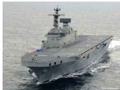
Корейский УДК «Токто», тащит не только вертолеты, но и до 10 танков

То, что приходит в голову среднестатистическому луркоёбу при слове «авианосец» — это лишь одна его разновидность ака тяжёлый ударный . Однако при необходимости юзаются и другие посудины, технически способные запускать с палубы различные девайсы с крыльями и винтами: