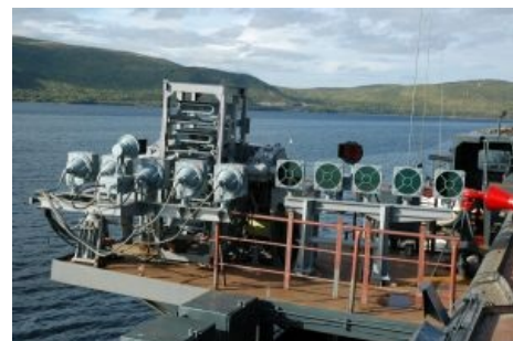
Посадочный светофор ака система «Луна»