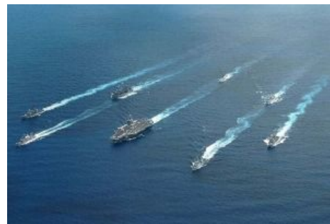
Типичная АУГ. По пиндосским меркам даже маленькая.