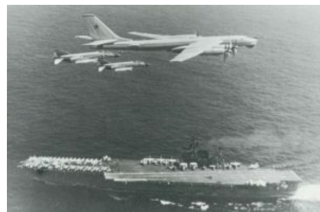
Классика троллинга в исполнении Ту-95

По сути своей авианосец весьма специфическая вещь. С появлением противокорабельных ракет и увешивания легких крейсеров всевозможной крылатой хуйнёй изначальный смысл авианосца как участника флотских междусобойчиков утерян: ствольная артиллерия умерла, а пулять друг по другу ракетами получается гораздо лучше, чем таскать с собой огромную лайбу, одновременно прикрывая ее от противника, который не дремлет. Тонкий намёк: вояки всерьёз проектировали пусковые установки ПКР, размещаемые в стандартных грузовых контейнерах, так что в случае чего можно обнаружить очень неприятный сюрприз, выпущенный с «гражданского» судна под нейтральным флагом. Если учесть, что даже «Гранит» брежневских времён, идя исключительно на низкой высоте, может пропилить предельные 200 км всего за 6 минут, то выбора нет — или постоянно держать в воздухе крыло (что еще и не во всякую погоду возможно физически), сжирая топливо и расходуя ресурс недешёвой техники, или надеяться на противоракеты крейсеров.