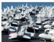
Ты хочешь рассказать о трудной парковке?