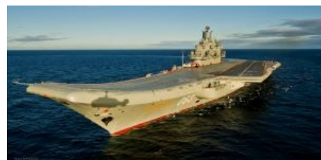
Кузя. Пустая палуба символизирует.

Так и была спроектирована четверка «городов» — авианосцы (точнее — тяжелые авианесущие крейсера, практически вымершие после Второй мировой в остальном мире) «Баку», «Киев», «Минск» и «Новороссийск». Разработка велась с одновременным конструированием под них специальных самолетов вертикального взлета и посадки Як-38 (он же «Як-об-палубу-хуяк»). Новаторское решение оказалось в итоге фейлом — вместо того, чтобы развивать авианосцы классической схемы с длинной взлеткой и горизонтальной посадкой, на выходе получили геморройный самолет (прозвище появилось не случайно) с самым высоким из серийных советских штурмовиков процентом аварийности [1] и авианосцы, которые никакую другую технику принимать не могли физически. А разгадка одна — строить сий тип кораблей можно было только на Черноморских заводах, а по международным договоренностям проходить турецкими проливами «чистые» авианосцы не могут.