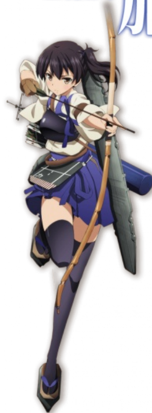
Авианосец класса «Кага» благоразумно держит взлётно-посадочную полосу за спиной