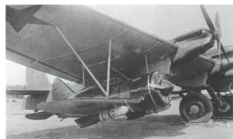
Мы поставили на твой самолет самолеты, чтобы ты мог запускать самолеты, летая на самолете.