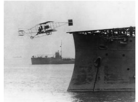
Так оно и начиналось