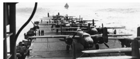
Бомбардировщики на авианосце. Нет, правда.

Что интересно, у основных участников европейского заруба авианосцев практически не было вообще. Немцы свой «Граф Цеппелин» к началу войны достроить не успели и не особо желали, палубные самолеты не завезли даже в виде законченного проекта, а потом стало уже не до того. Советские же инженеры отметились авианосцами летающими , прикантовав к тяжелому бомбардировщику два или три легких «ишака» (а дело было в том, что истребители и бомбардировщики того времени радикально отличались по дальности полёта, как следствие, практическая дальность бомбардировок снижалась, летать без прикрытия же было чистым самоубийством; позже к истребителям просто начали прикручивать дополнительные топливные баки, и проблема улетучилась). В результате в 1941 году, испытав сие чудо (так называемый «проект „Звено“», в просторечии — «летающий цирк