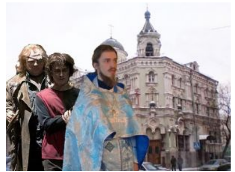
Фотожаба: Иллюстрация к рассказу «Успехи миссионерской миссии».