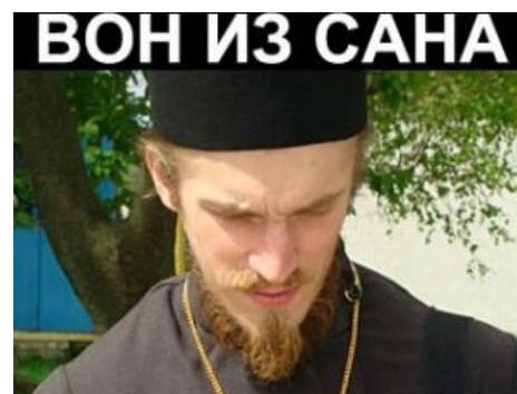
Фотожаба от противников Аббатуса

Так или иначе, все альтер-эго Аббатуса, буде они с никнеймом или без оно, легко и просто палятся по пене у рта, мозолям на правой руке, обилию оцепяток, заглавных букв (что выдает принадлежность Аббатуса к школоте ). Кроме того, в речи практически любого виртуала Аббатуса или же анонимуса в его исполнении рано или поздно зазвучат такие слова, как «анафема», «катафема», «маранафа» и «блядь».