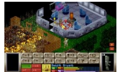
Battlescape: Страшный сон школоты

Первая часть игры была выпущена компанией Mythos Games и издана Microprose 31 декабря 1993 года (этакий новогодний подарок). Игра обрела массовую популярность благодаря удачной по тем временам графике, практически полностью разрушаемым или деформируемым объектам и отличному геймплею. Сюжет, как и в большинстве игр того времени, сводился к активному интро (оно даже было, а в CD версии даже видео [1] ) и предыстории об атаках загадочных пришельцев на мирных граждан и создании в не очень далёком 1999-м году международной организации X-COM для обороны Земли от этой всеобщей угрозы.