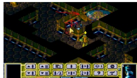
Архивация данных наглядно