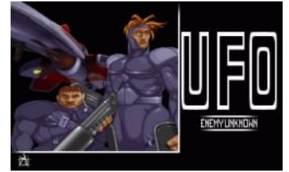
UFO: Enemy Unknown (он же X-COM: UFO Defense).

X-COM (в простонародье — уфощка ) — эпичная серия игр о попытках завоевания Земли злыми инопланетными пришельцами . Наиболее почитаемы геймерами первые две части — X-COM: UFO Defense (также известной как UFO: Enemy Unknown ) и X-COM: Terror From The Deep , вышедшие в 1993 и в 1995 годах соответственно. Вопрос о кошерности третьей части — X-COM: Apocalypse 1997 г. — является одной из дисциплин Специальной Олимпиады среди поклонников серии. После серии неудачных продолжений и спин-оффов игры, которые фанаты упоминают только в проклятиях, в 2012 г. вышел неплохой ремейк XCOM: Enemy Unknown . А в 2014 году был допилен гораздо более близкий по сути проект Xenonauts, сделанный за счёт неравнодушных граждан.