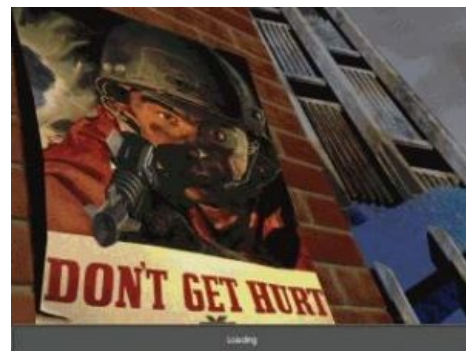
Агент X-COM следит за тобой .

результате, в игре осталось множество недоделанных фиц , а игровой процесс радикально поменялся, что привело к локальному холивари , в котором фанаты первых двух частей плевались и жаловались, что по сравнению с каноном оно не труЪ , а ньюфаги вещали о революционном реалтайме, полностью разрушаемом окружении, усложнённой экономической модели, вполне способном AI и особом, неподражаемом очаровании . Ранее, если зданию снести первый этаж, второй оставался висеть в воздухе. Теперь же, на место снесённых элементов пейзажа аккуратно, как по рельсам, съезжают расположенные выше куски. И, ЧСХ, прихлопывают насмерть всех, кто под ними оказался.