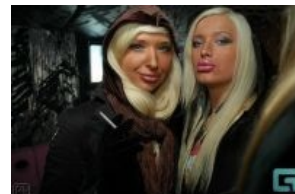
Гэндальф Серый и Саруман Белый в молодости

Рекомендуется к обстоятельному троллингу любой степени толщины.