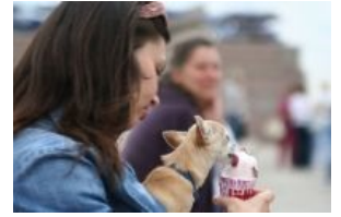
Тренировка функции. А так же неплохой способ обзавестись еще несколькими видами домашних животных .