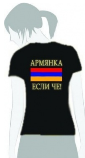
Маечка для кавказской сучки из Армении.