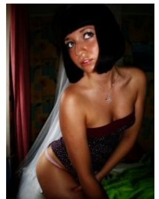
Сферический фотошоп в вакууме , украшенное трупно-зеленым солярием, челкой до бровей и неестественным блеском кожи.

Ездят на Peugeot или Citroën на младших курсах, в провинции и ебенях Украины попадают также Daewoo Matiz или Cherry QQ. Одна такая наделала шумиху в интернете, прославившись своей парковкой возле одесского привоза К старшим пересаживаются на более серьезные машины — различные Mercedes'ы, BMW, Lexus'ы или люкс-кроссоверы типа BMW X3 или Infiniti EX; иногда можно узреть нанесённую на кузов автомобиля аэрографию в стиле «розовые сопля» — котята, собачки, сердечки etc. Отделка салона тоже бывает в подобном стиле. Водительские права,