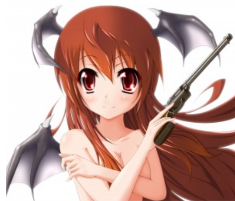
Коа с ковбойским «кольцом» Ня?