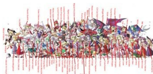
Altogether ранний (TH 01-08)