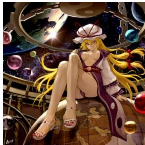
Юкари, её довление и нерезиновая

Чит. способность 2: В Curiosities of Lotus Asia Юкари невозбранно сделала себя «готик лолитой », « обоснуем » выступает заявление про сдерживание своей силы. А разгадка одна: только в этой форме