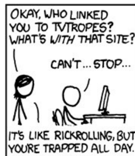
Xkcd в теме

Тем временем на тропях образовались собственные терминология и сленг. Особое место занимали названия тропов, абсурдные и непонятные непосвященному читателю. Любовь к каламбурам и игре слов выливалась в такую НЁХ как «Cloudcuckoolander» [1] , «Kick the dog» [2] или «The dragon» [3] . Когда градус неадекватности в названиях тропов зашкалил, на сайте появилось сообщество по предотвращению слишком непонятных названий SPOON , которое занялось выпилом наиболее бредовых и переименованием их во что-то попроще-попонятнее. С тех пор градус неадекватности заметно снизился: своеобразный язык сохранился, однако привыкнуть к нему не сложнее, чем к луркоязыку — было бы желание тропофажить .