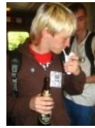
sXe такие sXe!