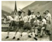
Предки современных sXe