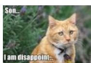
И он разочарован Disappoint, Disappoint everywhere!