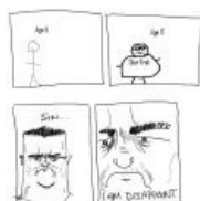
Отец недоволен фагготрией WHEN I WAS