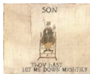
Омрачил душу мою ты, сын