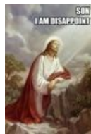
Иисус, я разочарован в тебе