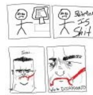
Why so disappoint?