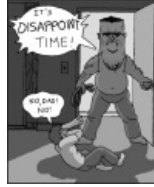
It's DISAPPOINT time!