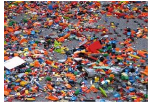
387 Oh, shi...