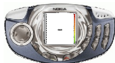
Nokia 3300, с которой спизжен дизайн