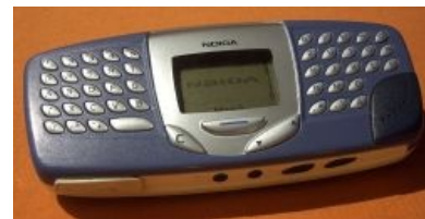
Nokia 5510: начало