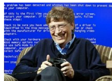
Знаменитый Билли на фоне знаменитого экрана