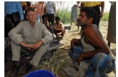
Билл Гейтс интервьюирует только что принятого на работу разработчика софта