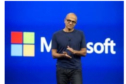
Генеральный директор М$ с 2014 года — индус . Капитан Очевидность рыдает