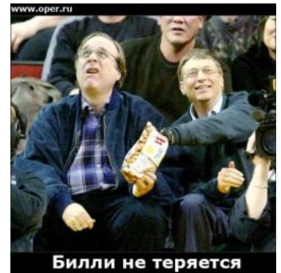
Билли не теряется