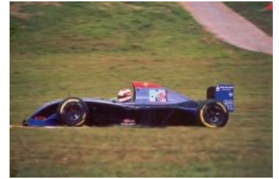
Машина-убийца с лого MTV на борту

на MTV-Телеэкспо (Культура/MTV- Телеэкспо, 01.12.2000) Так это было. Соседство Культуры и MTV. 2000 год