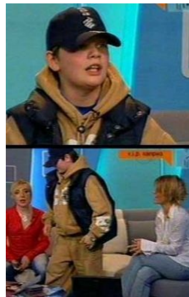
Такова целевая аудитория канала