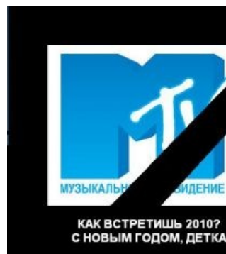
Happy New Year, bitches!