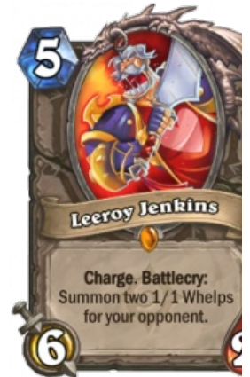
Карта «Leeroy Jenkins» в Hearthstone