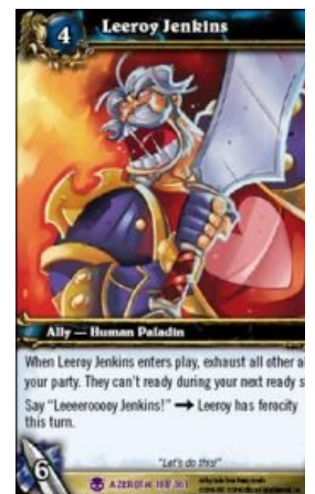
Карта «Leeroy Jenkins» в WoW TCG