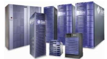
Естественная среда обитания

«Посадить двуногого автомата, можно нескольких, набирать счета вручную. И никакой жабы не надо. »