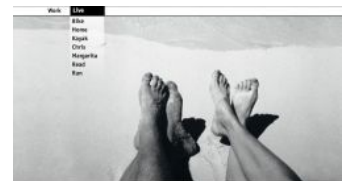
Life is too short to spend rewriting code. Working for Sun is the first step towards increased compile development experience on the planet. It makes the "write-rewrite-rewrite" process of Java so much "That's over what a drink does" better, you already program machines to making error free, maintenance of apps — and "That's for the generation the responsibility and as you know that. Being a working Java programmer, the responsibility and as you know that. Being a working Java programmer, the responsibility and as you know that.

Есть версия, что миф о «тормозности» Java еще связан с тем, что в доисторические времена в браузерах были апплеты, которые адски тормозили. Открытие странички с Java-апплетом вызывало подвисание браузера на минуту-другую, а в строке состояния появлялась надпись: «Приложеньице загружается...» — что не могло не радовать пользователей. Особенно цинично это выглядело, когда причиной тормозов был апплет с анимированной кнопкой «e-mail» размером 100 на 50 пикселей. Были даже спецпрограммы, чтобы генерировать такие апплеты для говносайтов.