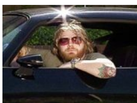
Привет, я — Райан Данн, и это «Пьяное вождение»