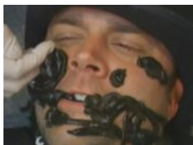
Типичное занятие Ноксвилла

Hi, I'm Johnny Knoxville, welcome to Jackass! Hi, I'm Johnny Knoxville, welcome to Jackass!