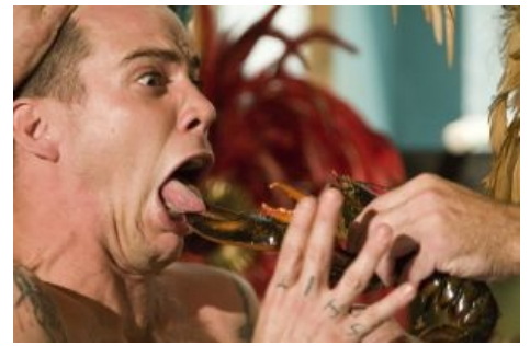
Стив изволят трапезничать.

команду последним, нашли его на блوشинном рынке . Отличается добрым нравом, по словам Понтиуса, никогда не отомстит за сыгранную над ним шутку (тот же Ноксвилл любил после обмазывания говном лезть ко всем обниматься). Любил трюки с животными (особенно с опасными, вроде аллигаторов или змей) и кокос. С зависимостью таки справился и теперь ни-ни. Очень любит поплевать, поэтому блюет в каждом сезоне и фильме.