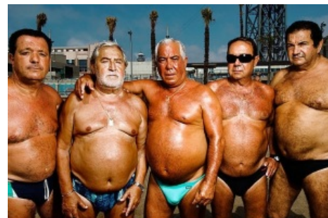
Те кто в действительности платят за все эти поездки в Дубай, Майами и Вегас, но никогда не бывают отмечены на фотках гламурных девушек в Инстаграмме.

Меметичность инстаграма по большей части связана с обилием в нём особ женского пола, по внешним признакам соответствующим типажам « Тупая пизда », « Гламурное кисо » и « VIP/Самки ». Характерные черты — множество фотографий из путешествий, с дорогих курортов, ресторанов, яхт и вилл, при этом совершенно непонятно, откуда берутся средства на столь красивую жизнь. Ларчик просто открывается — они все являются эскортницами , чей образ жизни спонсируется богатыми папиками, что, разумеется, тщательно скрывается. Характерная для них привычка постоянно менять ники в инстаграме тоже связана с тем, что они пытаются замести следы после того, как инфа об их похождениях выплывает наружу. Многие из них плотно сидят на коксе и прочих веществах . Те же из них, кто рационально тратят полученные от папиков бабки и не спускают их на вещества, вполне могут за несколько лет столько заработать «непосильным трудом», что хватит на всю оставшуюся жизнь.