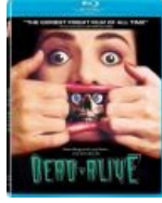
Постер фильма про зомби