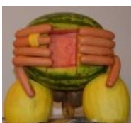
Это даже бывает вкусным