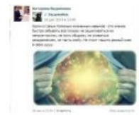
Ванильные пёзды знают толк в сабже