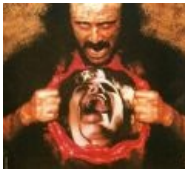
В фильмах ужасов