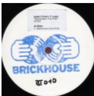
Теперь и на виниле!