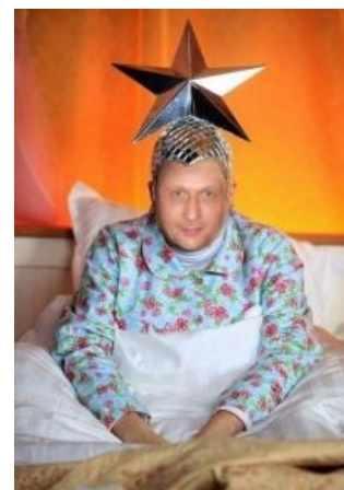
Фотожаба с Бондерсаном