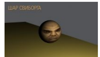
Шар Свиборга. Он брутален. И смотрит на тебя, как на говно.

Не лишним будет указать и некоторые факты из жизни Свиборга. Так, его брутальный и полный осмысленного бессердечия взгляд заставляет смотрящего на него чувствовать себя говном. Любой, примеривший «маску» Свиборга, может почувствовать себя брутальным, а также заставить своего собеседника (и даже простого прохожего) очутиться в «духовном унитазе».