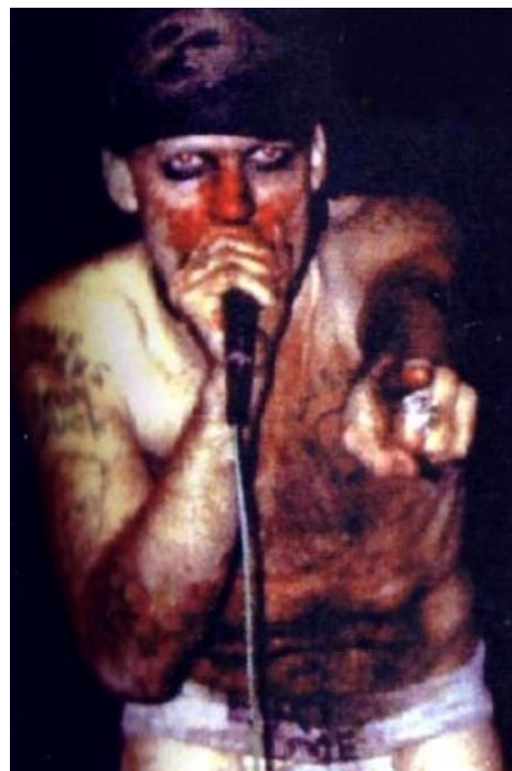
Ты хуй. Да, именно ты!