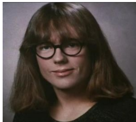
Тот самый тролль.