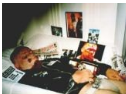
GG Allin на собственных ...и после оных похоронах...