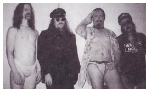
Murder Junkies.Три четверти.