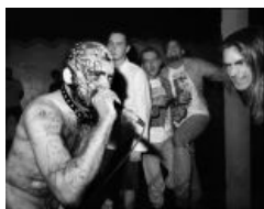
Концерт GG, сферический в вакууме