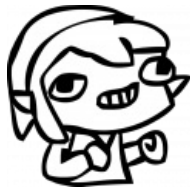
Оригинал из комикса