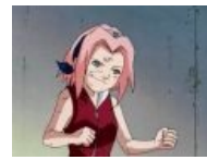
Сакура рольплеит fsjal