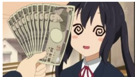
At first it was like

Пикча сразу же попала на лунные аниму-форумы, где кто-то дорисовал вторую панель, какбэ намекающую на продажность Азусы, и всё заверте... Шутка пришлась юзерам по нраву, и руку с пачкой бабла начали прилеплять к другим пикчам, демонстрируя, на что готов тот или иной персонаж за бабки. Или не готов — сценарии придумывали абсолютно разные, а подразумеваться стал не только секс за деньги. Также в качестве оригинала стали пользоваться уже не только китайские порномультрики , но и живых людей и даже небо , даже Аллаха .