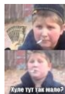
Ты на пенёк сел — должен был косарь отдать!