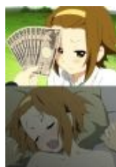
И Рицу тоже