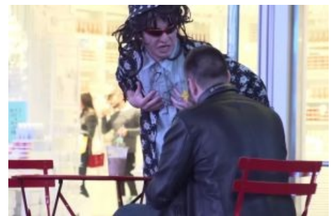
Фрэнк доёбывается до какого-то случайного чувака ради контента стёба, великой справедливости , социального комментария и спасения человечества