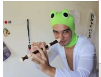
Духовно богатый Саламандер Мэн