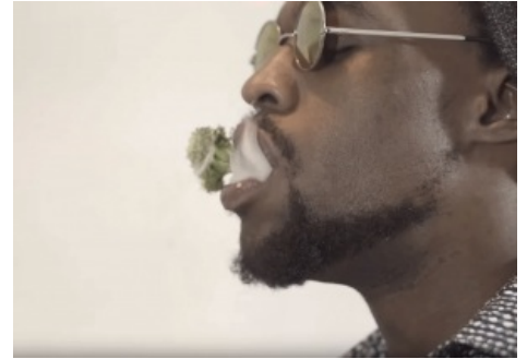
Фрэнк и ко развращают молодёжь

НЕ БУДУ ПАЯСНИЧАТЬ, КОНЕЧНО ЖЕ Я БЫ УБИЛ ЕГО. ВЫ ШУТИТЕ? Я БЫ РАЗМАЗАЛ ЕГО ПО ВСЕЙ ЗЕМЛЕ РАДИ 18 МИЛЛИАРДОВ. Я БЫ ЭТО СДЕЛАЛ НА ГЛАЗАХ МИЛЛИОНОВ ЛЮДЕЙ. Я БЫ ВЫРВАЛ КАЖДЫЙ ЗУБИК У ЭТОЙ СОПЛИ БЕЗ РАЗДУМИЙ, СМОТЯ НА ЕГО ДЕФОРМИРОВАННОЕ ЛИЦО, И ДУМАЯ «О ДА, ЭТО 18 МИЛЛИАРДОВ, ДЕТКА». СЕРЬЁЗНО, СТАВКИ СЛИШКОМ ВЫСОКИ, Я БЫ ЭТО СДЕЛАЛ ДАЖЕ ЗА ТЫСЯЧУ ДОЛЛАРОВ, НО ЗА 18 МИЛЛИАРДОВ? ЗА 18 МИЛЛИАРДОВ Я БЫ ВЗЯЛ ЭТОГО УЁБКА И РАЗМАЗАЛ БЫ ПО БЕГОВОЙ ДОРОЖКЕ. ЗА 18 МИЛЛИАРДОВ Я БЫ ПРИВЯЗАЛ ЕГО К ВЕРЁВКЕ И СО ВСЕЙ ДУРИ РАЗЪЕБАЛ БЫ ЕГО. ДА Я БЫ УБИЛ 18 МИЛЛИАРД СОБАЧЕК ЗА 18 МИЛЛИАРДОВ ДОЛЛАРОВ. У ЭТОЙ КРОХИ ДАЖЕ ВОСПОМИНАНИЙ ТО НЕТ, ЕДИНСТВЕННОЕ, ЧТО ОНА БУДЕТ ПОМНИТЬ — МОЯ НОГА. 18 МИЛЛИАРДОВ МОЖНО ПОЖЕРТВОВАТЬ В КАКОЙ-НИБУДЬ СОБАЧИЙ ФОНД, КОТОРЫЙ СДЕЛАЕТ МИЛЛИАРД, БЛЯТЬ, СОБАЧЕК. ЕСЛИ ПОДУМАТЬ, ТО РАЗЪЕБЫВАНИЕ ЩЕНОЧКА НОГОЙ ЗА 18 МИЛЛИАРДОВ МОЖЕТ ПРИВЕСТИ ТОЛЬКО К ХОРОШЕМУ