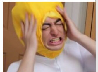
Лемон Мэн пытается пребывать в гармонии со своим телом

После всех этих событий Фрэнк уже один оказывается на хромосомной плантации, где ему предстояло выжрать тарелку васаби быстрее всех своих конкурентов, чтобы Фрэнку достались все хромосомы и Чин Чин забрал бы их у него. Наш япошка просрал это соревнование из-за ранки на языке. НО! Фрэнк со своим новым товарищем — Красным Хером, придумал гениальный план: спиздить образцы крови детишек из больницы. Безумный план сработал, Чин Чин был доволен и вышвырнул Фрэнка. Фрэнк скитался по рисовым полям — краю омнивселенной, где встречал ходящих мертвецов, разваливающихся от одного только взгляда. Какое-то внутреннее чувство приказало Фрэнку пойти в гору, где находит дерево и какое-то странное существо, которое является с деревом одним целым. Это безмянное существо научило Фрэнка способу прятать хромосомы от Чин Чина. Надо просто хранить хромосомы в других существах или даже травке. Продолжив своё приключение, Фрэнк встречают сельскую женщину, которая посреди ёбанного края омнивселенной решила ждать какого-нибудь путешественника, чтобы ублажать его рисовыми пирожками и минетом . Дело у Фрэнка было близко к половой ебле , но он слышит внутренний голос, и ВНЕЗАПНО , эта девушка оказывается замаскированным подсосом Тёмного Лорда. Хотя и оппонент Фрэнка был чимпиллой, тот быстро огрёл стулом и сдох, после чего Фрэнк использует недавно приобретенный скилл и поглащает вею чакру все хромосомы богомолу-подобного падонка. После всего этого, наш герой эпично покидает рисовые поля.