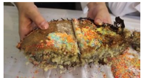
Торт с начинкой из волос. Этот торт в своём неготовом состоянии выглядел ещё более мерзко

Ранние видео Филзи целиком и полностью состояли из пиздежа Фрэнка перед камерой. Примечательным в этих роликах были пародии на национальные стереотипы или стереотипичные типажи поведения людей. Также сабж выпускал серию роликов JAPANESE 101 , где обучал зрителей плохим словечкам на языке своей родной страны. Ближе к началу творчества зародилась рубрика LOSER READS HATER COMMENTS , где, как следует из названия, сабж читает комменты не понявших ну настолько толстого троллинга людей , в ответ поливая их говном. Время шло, и количество пиздежа перед камерой постепенно снижалось, и ролики становились более богатыми с визуальной точки зрения. В большом количестве мы можем лицезреть, как Фрэнк намеренно творит хуйню перед лицом кучи людей. Эпичные ролики с отвратительной готовкой снимались совместно с iDubbbz, MaxMoeFoe, HowToBasic и ящиком текилы. На протяжении всей истории канала, выходила стёбная музыка, а также прослеживалась тема готовки. Проще говоря, сабж значит: