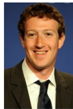
Добрый Марк Эллиот Цукерберг

Придуман юным расовым евреем по имени Марк Цукерберг (англ. Mark Elliot Zuckerberg , евр. рас. : מרק צוקרברג, надм. Марк Сахарогор, род. 14 мая 1984) на втором курсе Гарварда. В январе 2004 года Цукерберг начал писать код для нового веб-сайта, а уже 4 февраля ФВ заработал. Идея названия ФВ связана с годами, когда Цукерберг учился в старшей школе, в которой каждому поступившему выдавался справочник, где были фотки, адреса и телефоны всех одноклассников. Оригинальное название справочника было «The Photo Address Book», но все срать хотели на столь длинное название, поэтому его называли просто «The Facebook».