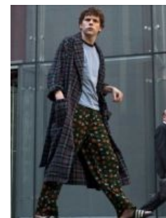
Звезда в повседневной одежде

«Нельзя завести 500 миллионов друзей, не нажив ни одного врага. »