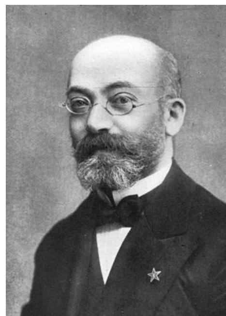
Ля Эсперантино (псевдоним создателя этого языка)