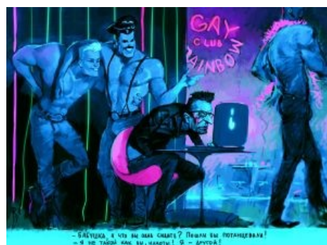
Карикатура на Другого