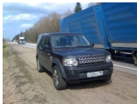
Тот самый «Лендровер» Рустема, он ездит на нём до сих пор (05.2010).