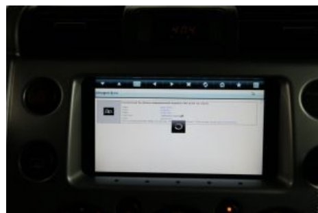
Тёма неустанно следит за Другим из своего Кукусика.