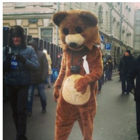
Другой на шествии кокозиции