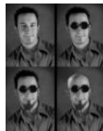
Тот самый Район Вернон