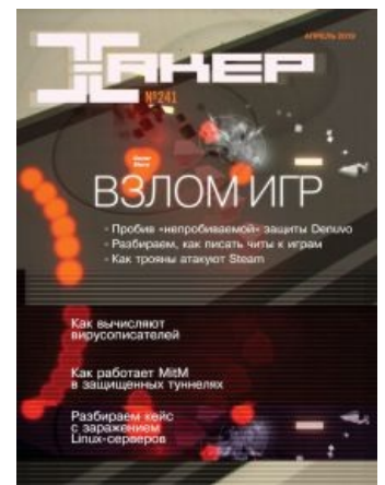
Наконец-то что-то написали про то, как это говно взламывается