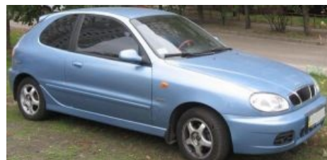
Стоковый Lanos Sport