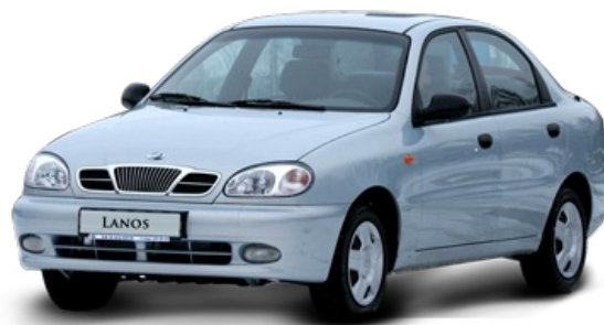
Daewoo Lanos Собственно, сам эпизод.

Деу Ланос стал известным как мем в фильме «Ананасовый Экспресс» («Pineapple Express»). После данного фильма самой нелепой и позорной смертью считается быть убитым Ланосом.