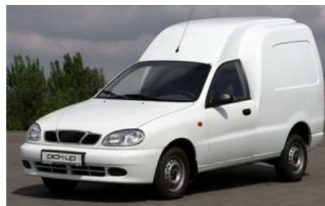
Пикап такой пикап

Слово « енирт спорт» не зря фигурирует в названии, ибо модель комплектовалась даже 1,6 литровым опелевским движком на 106 л.с, максимальным для модельного ряда Ланос. А стоковая коробка-автомат до сих пор удивляет ланосоводов-нюфагов. Существует документированное подтверждение возможности разогнаться на Ланосе свыше 200 км/ч (см. ниже). Алсо, несущие и каркасные части сделаны из таки металла, а не ложкового алюминия, который использует ЗАЗ. При одинаковых условиях столкновения, от олдфажного ланоса-корейца и его пассажиров останется куда больше, чем от ланоса-запорожца. И две подушки безопасности, которые реально работают, там тоже есть. Владельцы спорт-версии смотрят на все остальные модификации Lanos как на говно и считают свою единственной кошерной, православной и труЪ модификацией. Примечательно, что Зд-хэтчбек изначально и был единственной модификацией Ланоса, на базе которой уже потом допилили остальные типы кузова.