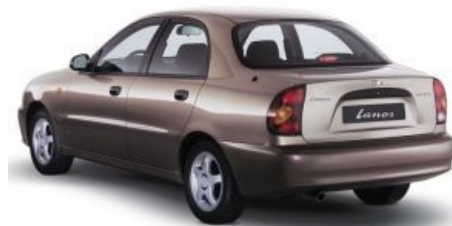
Они убили Кенни!

Помимо такси очень часто встречается как гражданская машина. Численность Ланосов-седанов в Украине уже давно превышает поголовье ТАЗов разных моделей и модификаций. Подразделяют на Lanos-поляк, собранный в Польше и дособранный методом прикручивания колес и сидений украинскими ручками, и ZAZ Lanos, полностью склепанный на АвтоЗАЗе, что не придало ему ни надёжности, ни престижности, кроме более низкой цены и немного другого внешнего вида.