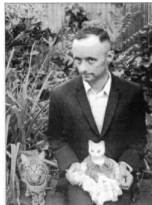
Дэвид Тибет и котик.

Стиль исполнения представляет собой в большинстве случаев зачитывание текста под музыку. Пения обычно нет как такового; иногда это завораживает, а иногда вызывает отвращение. Много споров на тему «слушать или нет» вызывает козлиный тенор Дэвида Тибета, которым он исполняет все свои песни, равно как и сверхпримитивные местами минусовки.