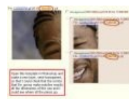
И ещё, плюс небольшая инструкция