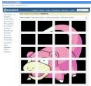
Комбо вконтакте. Алсо, деанон такой деанон