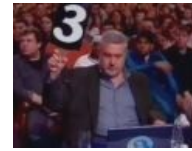
Гусман - величайший в мире combo breaker!