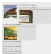
Пример удачного комбо