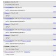
И даже на demotivation о нем знают...