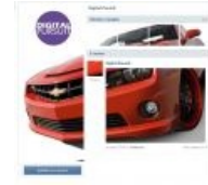
Ещё одно комбо там же