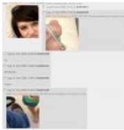
Не очень удачное С-с-combo комбо (50% complete)