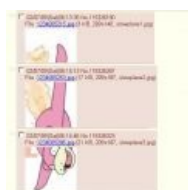
Простейшее комбо внутри треда