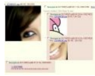
Внезапно фэйл стал вином