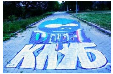
Йа рисую на асфальте Drupal-каплю

Отдельные drupal-задроты из Бульбасранитраны впали в детство и нарисовали гигантскую каплю — символ Drupal. Мало того, они начитали под это дело рэпчик и засняли процесс на видео.