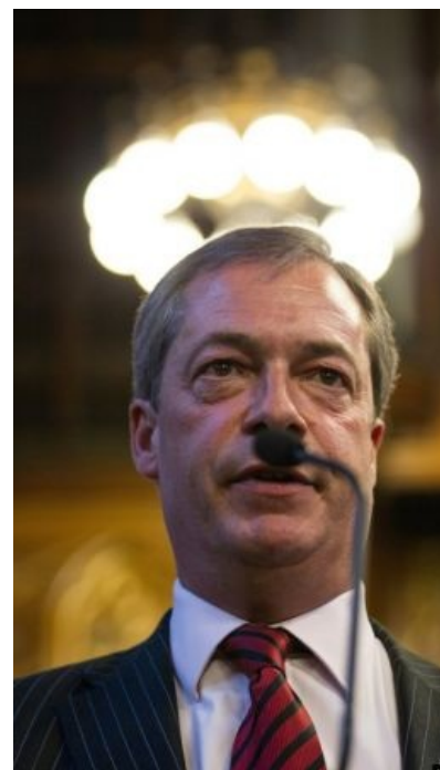
Освальд Мосли гордился бы

Найджел после победы в битве за расовую чистоту пивных