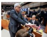
Свобода СМИ по ЕС