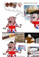
Что ожидается после