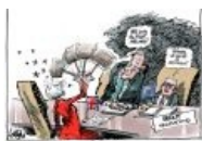
Как Тереза Мэй решала проблему