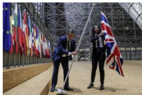
Финита ля комедия!

UPD: После позорного ухода Терезы Мэй в отставку премьером стал меметичный Борис Джонсон, этакий Дональд Трамп британского разлива-с, который тут же пришёл к выводу, что из ЕС надо выходить наижэстачайшым образом, с которым тут же не преминул ознакомить парламент, разогнав его КЕМ. Парламент не согласился и обратился в суд, признавший шатдаун незаконным. Досталось даже Её Величеству, ибо приостановка работы осуществилась с её позволения.